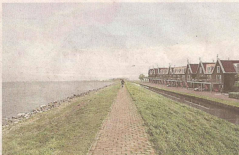
De dijkwoningen die er voorlopig niet komen. ILLUSTRATIE WOONZORG NEDERLAND

Het ziet er naar uit de Woonzorg wil meewerken aan het plan, op voorwaarde dat omwonenden het er ook